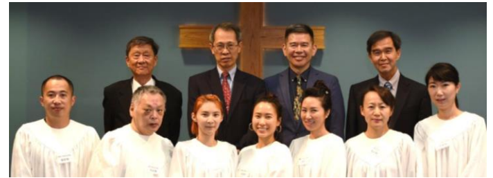
7/21 受洗重生的弟兄姐妹