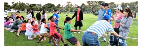
7/4 喜樂源國慶野餐會中拔河比賽