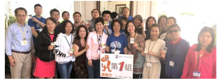
2019 退修會第 1 組

❖ 如果神的子民都能明白，因主的名合而為一，共享主的同在，全身靠同一聖靈聯絡，放膽宣告主的應許：凡同心合意的祈求，天父必成全。那麼，祝福還會加倍呢！~慕安德烈。 歡迎參加週三禱告會，本週也為活泉、青年兩個團契禱告。